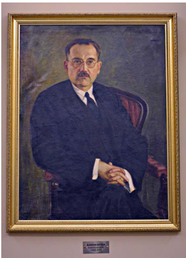
Festménye a városháza első emeletén látható.